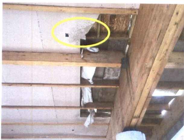
Fotografía N°3: Ilustración de la humedad en planchas de yeso cartón del cielo del salón.