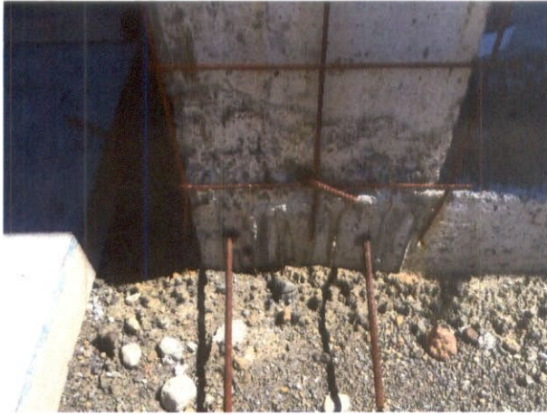
Fotografía N°7: Detalle de zona inferior de pilar con enfierradura y malla oxidada.