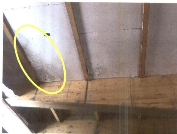
Fotografía N°4: Detalle de otras planchas de yeso cartón de cielo con manchas en el salón producto de la humedad.