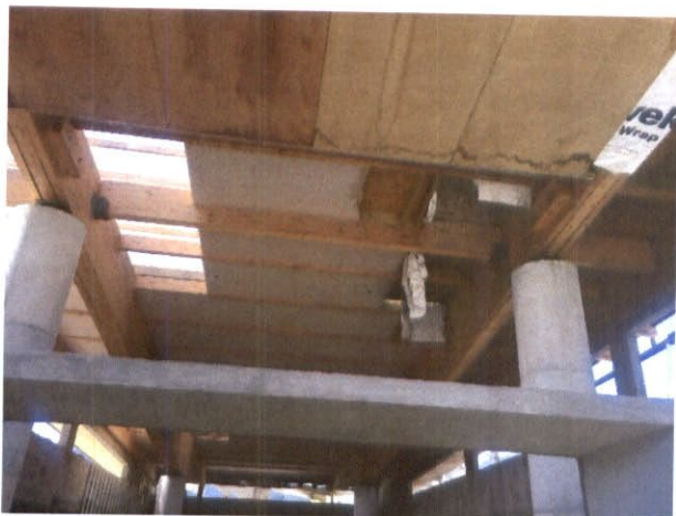
Fotografía N°1: Vista de placas enchapadas manchadas producto de la filtración de aguas lluvias.