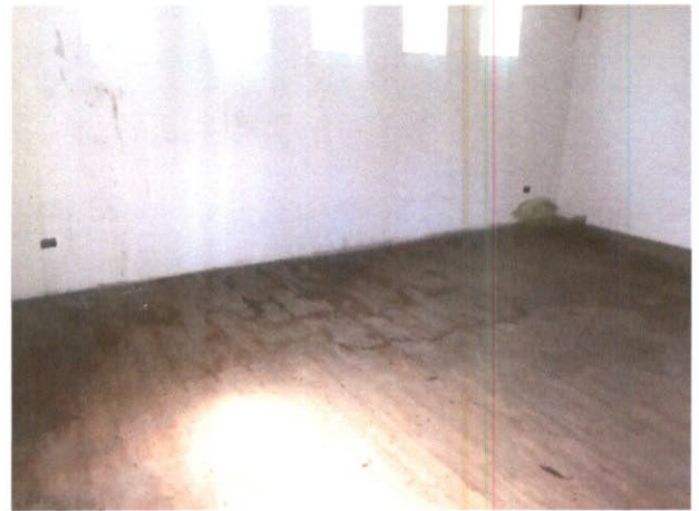
Fotografía N°8: Vista del daño acontecido en piso flotante en el interior del jardín infantil, producto de la filtración de aguas lluvias.