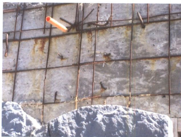
Fotografía N°6: Detalle de enfierradura oxidada en soporte de revestimiento de piedra