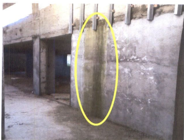
Fotografía N°5: Elevación de muro de hormigón con manchas dañados por la filtración de aguas lluvias.