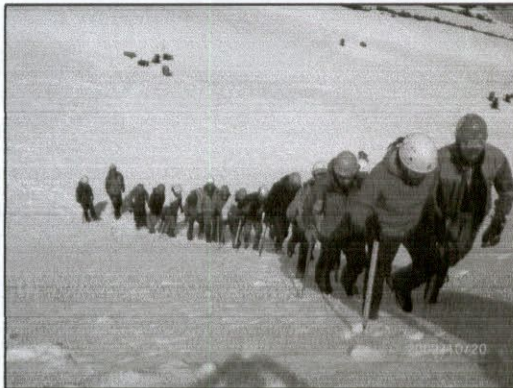
TECNICAS DE PROGRESION Y DESCENSOS