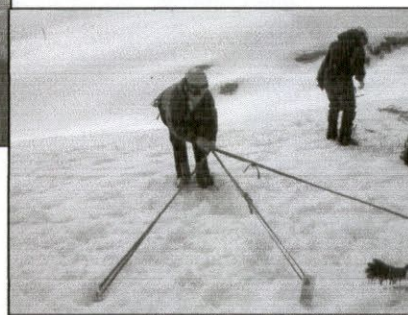
TECNICAS DE ANCLAJES