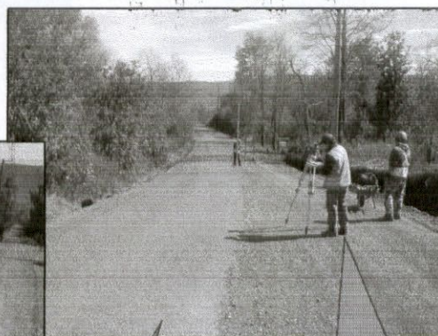
TERRENO ESTRUCTURADO 3.20 Mts. ancho x 3 cms. de asfalto