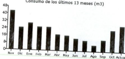
Consumo de los últimos 13 meses (m3)