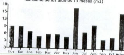
Consumo de los últimos 13 meses (m3)

Timbre Electrónico SII Res. 74 del 2005. - Verifique Documento: www.sii.cl