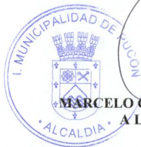
MARCELO CONCHA VILLAGRA ALCALDE(S)