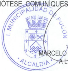
MARCELO CONCHA VILLAGRA ALCALDE (S)