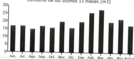
Consumo de los últimos 13 meses (m3)