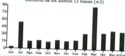
Consumo de los últimos 13 meses (m3)