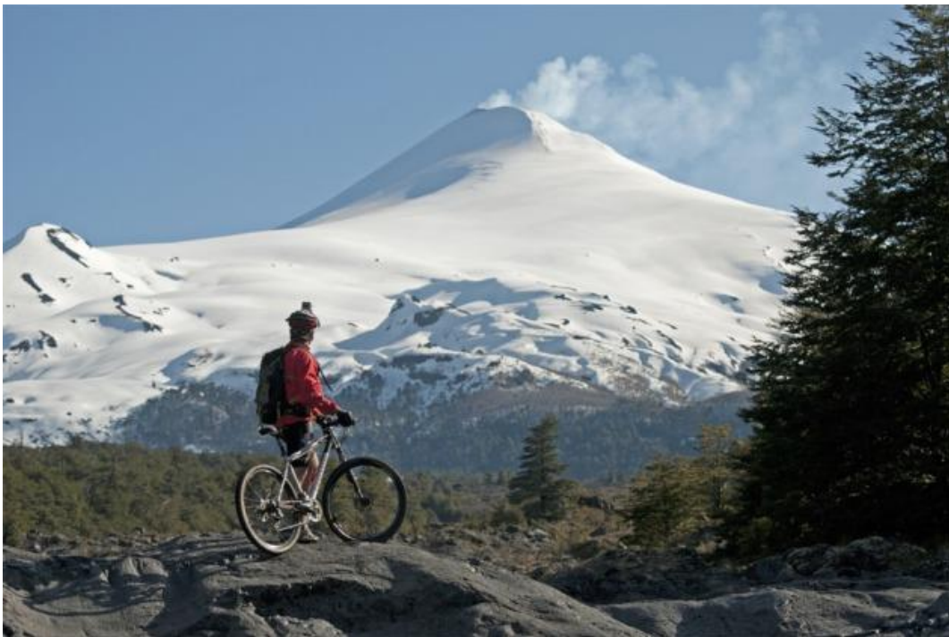
Pucón – Donde el turismo vive...